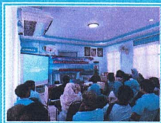
กิจกรรม : จัดพื่อเพียงต้านทุจริต